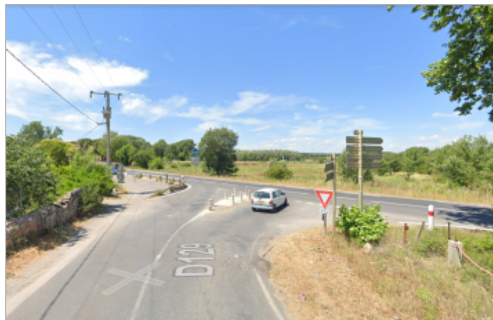
Jonction entre RD129 et RD2E5