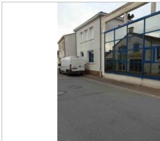
Point de vue du site