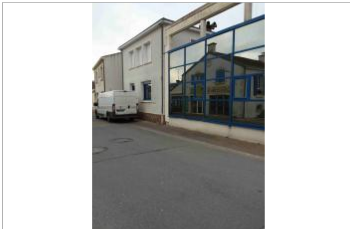
Point de vue du site