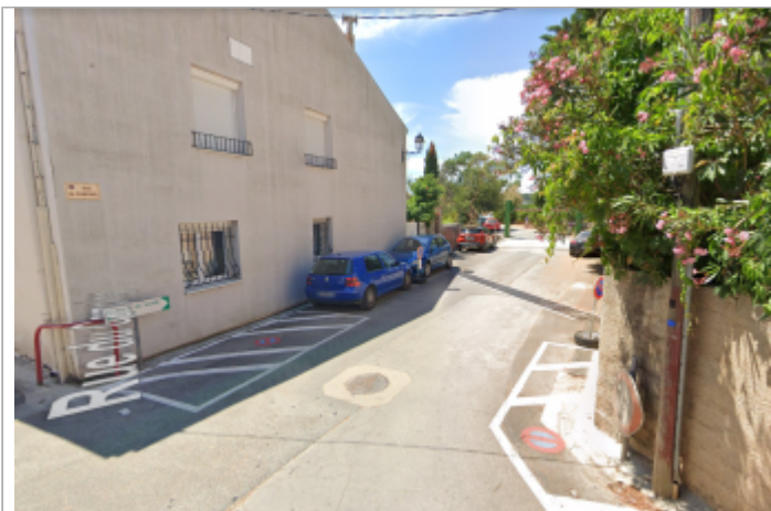
Rue du Camping depuis la rue du Moulin