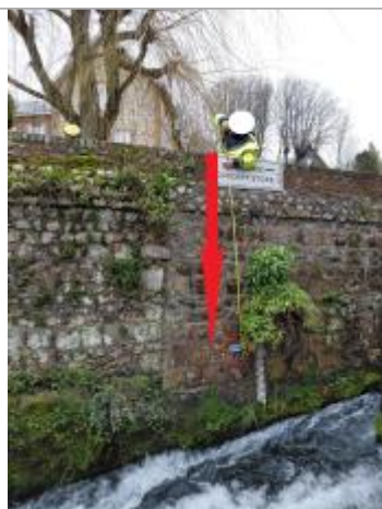
Laisse de crue à 245 cm/haut du mur.

Altitude calculée de l'eau (en m) : 10.59