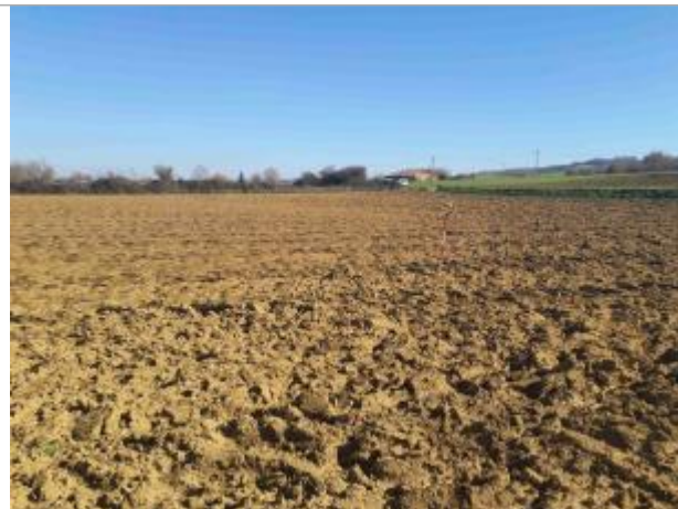
La laisse se situe au niveau de la perche du GPS

Coordonnées WGS84 : X: 1.05162450 / Y: 43.90523300