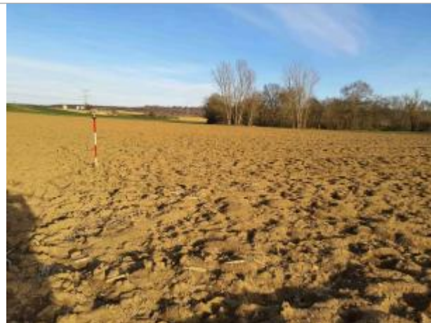
La laisse se situe au niveau de la perche du GPS - Photo © AGERIN

Coordonnées WGS84 : X: 1.06259380 / Y: 43.91956420