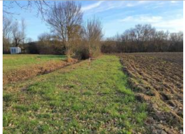
La laisse se situe au niveau de la perche du GPS

Coordonnées WGS84 : X: 1.06099970 / Y: 43.91881250