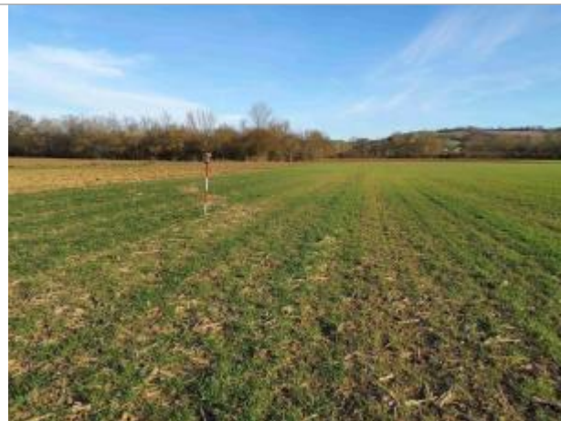
La laisse se situe au niveau de la perche du GPS

Coordonnées WGS84 : X: 1.05866290 / Y: 43.91775970