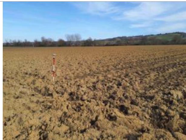
La laîsse se situe au niveau de la perche du GPS

Coordonnées WGS84 : X: 1.04887710 / Y: 43.90876370