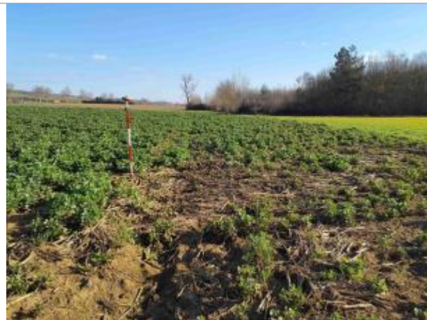
La laîsse se situe au niveau de la perche du GPS

Coordonnées WGS84 : X: 1.04072530 / Y: 43.90399930