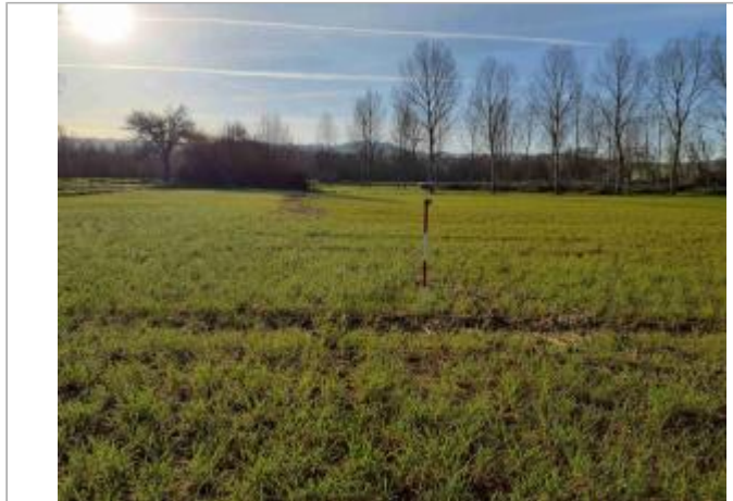
La laisse se situe au niveau de la perche du GPS

Coordonnées WGS84 : X: 1.03572700 / Y: 43.90003660