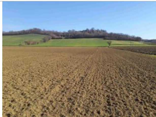
La laisse se situe au niveau de la perche du GPS

Coordonnées WGS84 : X: 1.10315280 / Y: 43.94594110