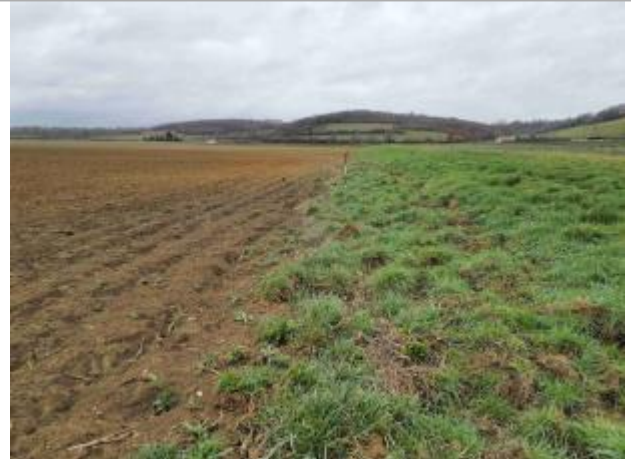
La laisse se situe au niveau de la perche du GPS

Coordonnées WGS84 : X: 1.11185660 / Y: 43.96286410