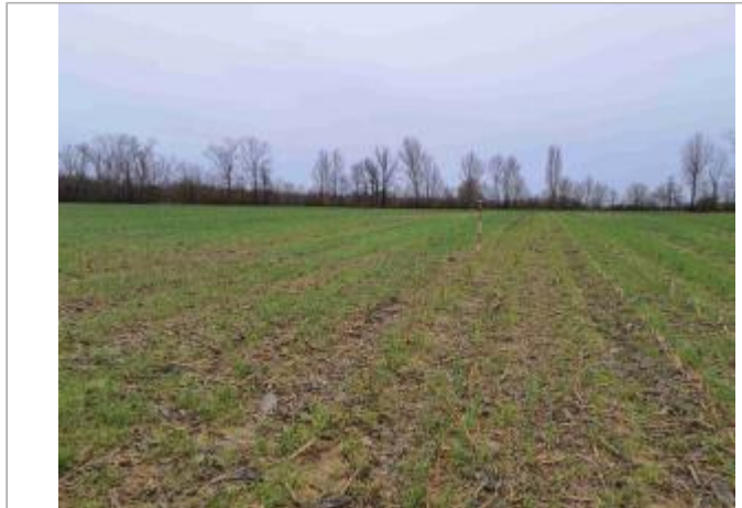
La laïsse se situe au niveau de la perche du GPS

Coordonnées WGS84 : X: 0.95377680 / Y: 43.85464840