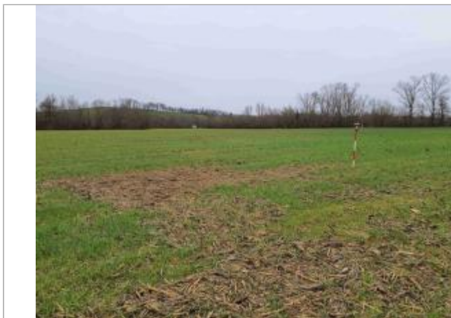
La laîsse se situe au niveau de la perche du GPS

Coordonnées WGS84 : X: 0.95365350 / Y: 43.85491450