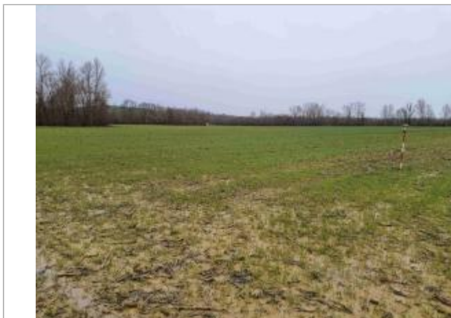
La laisse se situe au niveau de la perche du GPS

Coordonnées WGS84 : X: 0.95324330 / Y: 43.85318780