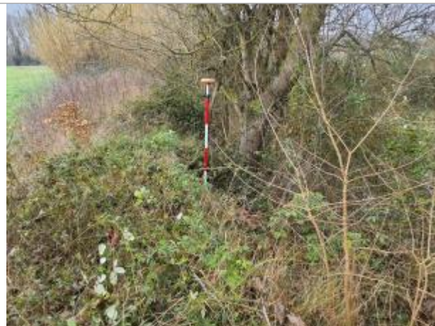
La laisse se situe au niveau de la perche du GPS

Coordonnées WGS84 : X: 1.11593680 / Y: 43.96483800