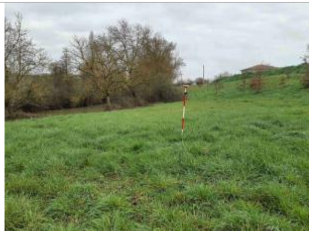
La laisse se situe au niveau de la perche du GPS

Coordonnées WGS84 : X: 1.11418860 / Y: 43.95994570