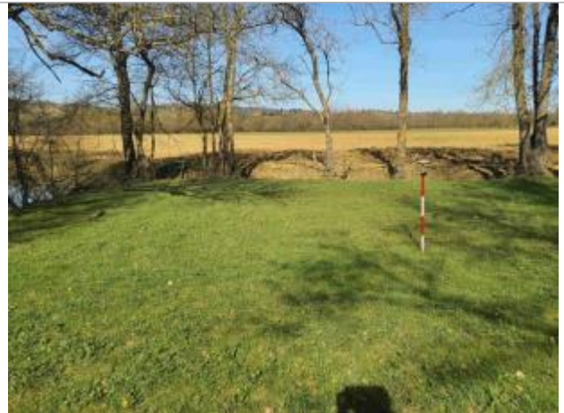
La laisse se situe au niveau de la perche du GPS - Photo © AGERIN

Coordonnées WGS84 : X: 1.05617930 / Y: 43.91110960