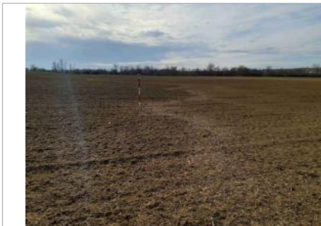
La laisse se situe au niveau de la perche du GPS - Photo © AGERIN

Coordonnées WGS84 : X: 1.01834640 / Y: 43.88804590