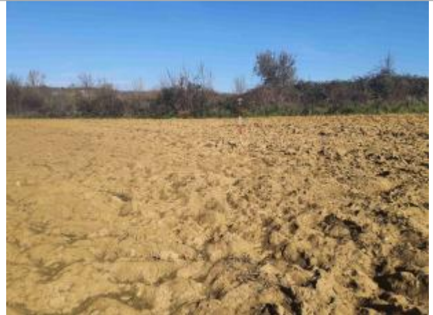
La laisse se situe au niveau de la perche du GPS

Coordonnées WGS84 : X: 1.05230670 / Y: 43.90569910