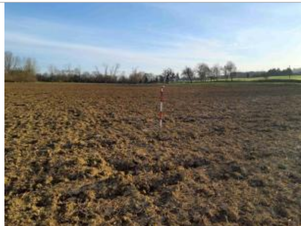
La laïsse se situe au niveau de la perche du GPS

Coordonnées WGS84 : X: 1.04492210 / Y: 43.90138030