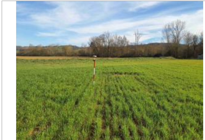
La laisse se situe au niveau de la perche du GPS

Coordonnées WGS84 : X: 1.04791200 / Y: 43.90783480