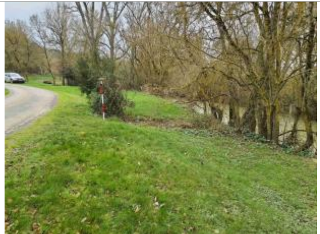
La laisse se situe au niveau de la perche du GPS - Photo © AGERIN

Coordonnées WGS84 : X: 1.08673050 / Y: 43.91979670