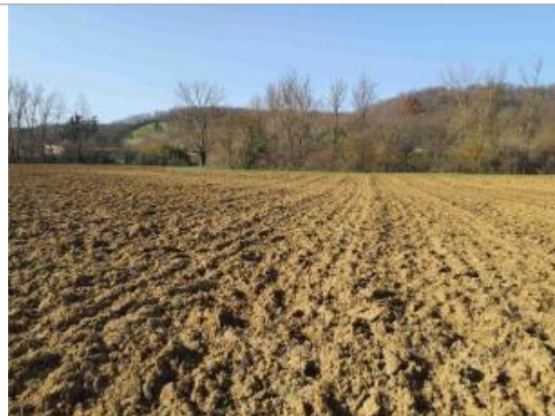
La laîsse se situe au niveau de la perche du GPS