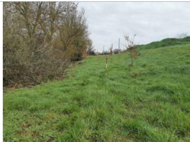
La laisse se situe au niveau de la perche du GPS

Coordonnées WGS84 : X: 1.11433600 / Y: 43.96021200