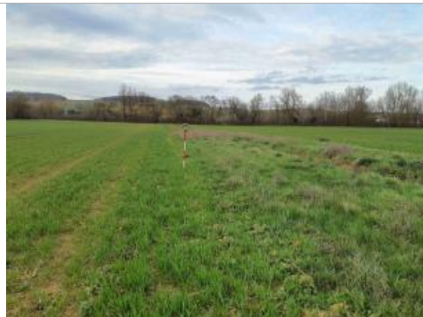
La laisse se situe au niveau de la perche du GPS

Coordonnées WGS84 : X: 1.02944710 / Y: 43.89301160