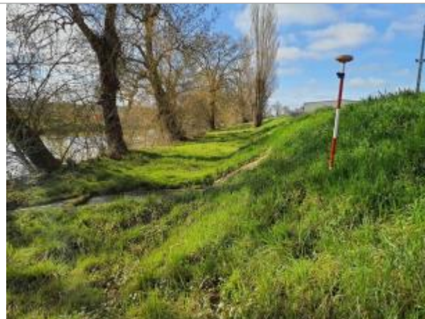
La laisse se situe au niveau de la perche du GPS

Coordonnées WGS84 : X: 0.99094310 / Y: 43.87873970