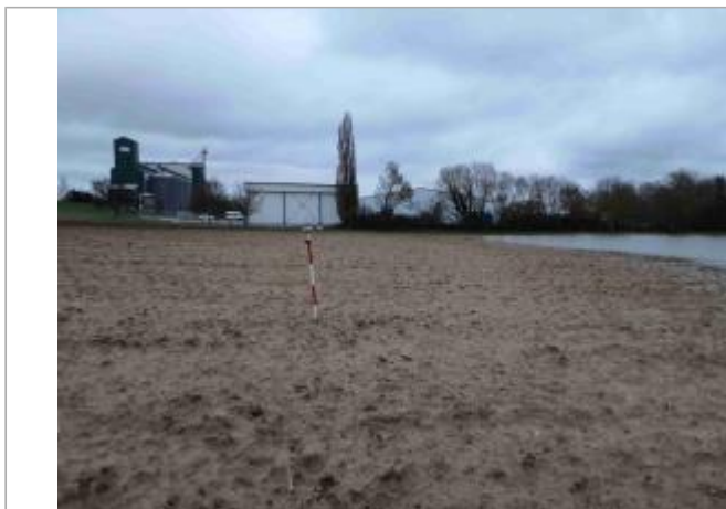
La laisse se situe au niveau de la perche du GPS

Coordonnées WGS84 : X: 0.97329000 / Y: 43.87262180