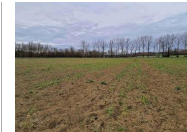
La laisse se situe au niveau de la perche du GPS

Coordonnées WGS84 : X: 0.91624200 / Y: 43.82292650