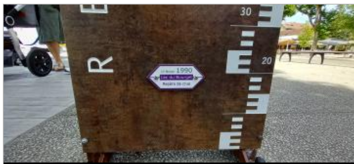
Repère de crue 17 février 1990