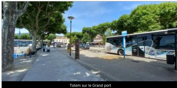
Totem sur le Grand port