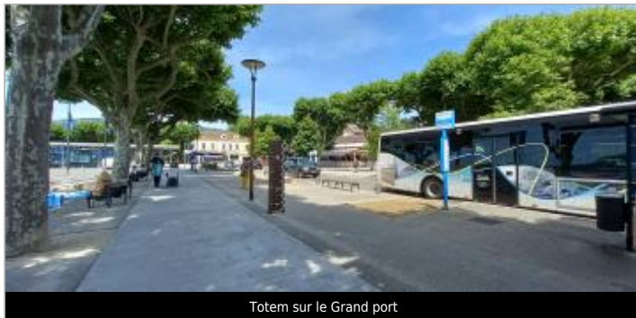
Totem sur le Grand port