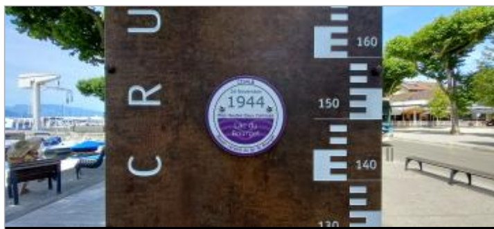
Repère de crue 26 novembre 1944