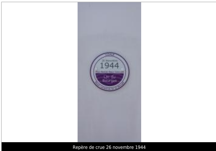
Repère de crue 26 novembre 1944

Altitude calculée de l'eau (en m) : 235.27 m