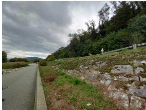
Sentier lacustre proche de la plage du Rowing