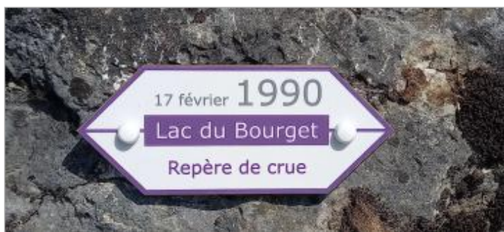
Repère de crue 17 février 1990