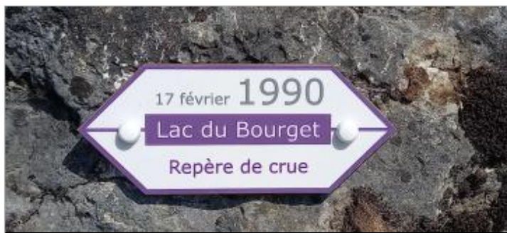
Repère de crue 17 février 1990