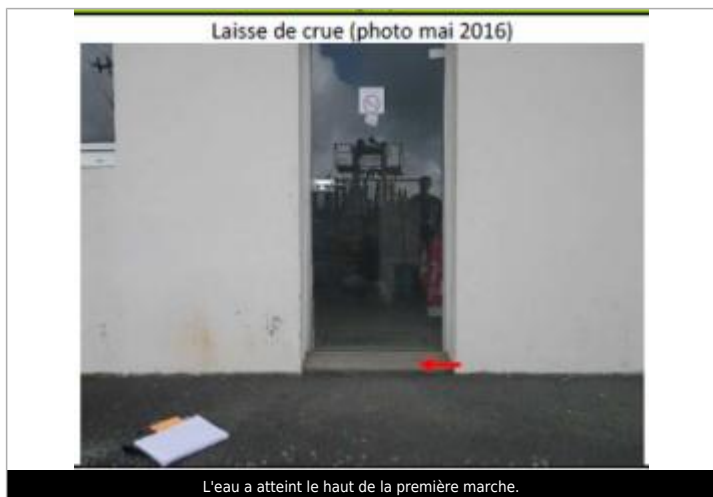
L'eau a atteint le haut de la première marche.

Maximum de l'inondation : Oui Visibilité : Non État du repère : Disparu Pérennité : Aucune