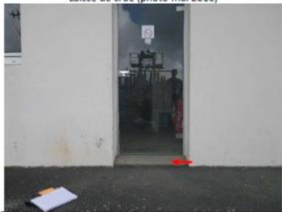
L'eau a atteint le haut de la première marche.