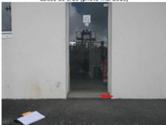
L'eau a atteint le haut de la première marche.