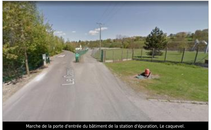
Marche de la porte d'entrée du bâtiment de la station d'épuration, Le caquevel.

Coordonnées WGS84 : X: -1.21666490 / Y: 48.85337510