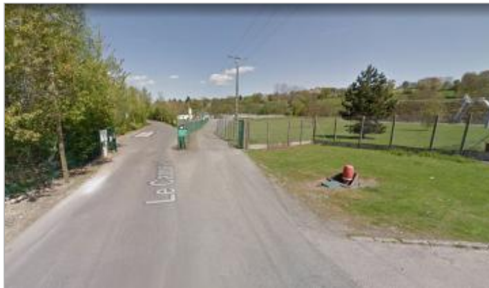
Marche de la porte d'entrée du bâtiment de la station d'épuration, Le caquevel.