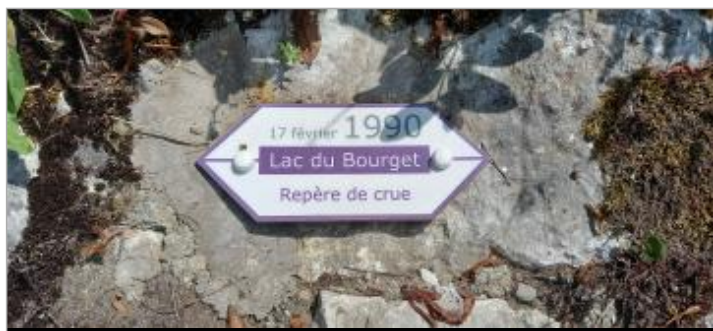
Repère de crue 17 février 1990