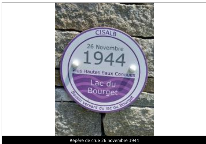
Repère de crue 26 novembre 1944

Altitude calculée de l'eau (en m) : 235.27 m