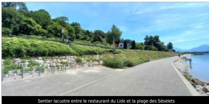
Sentier lacustre entre le restaurant du Lido et la plage des Séselets