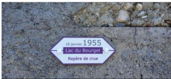
Repère de crue 18 janvier 1955