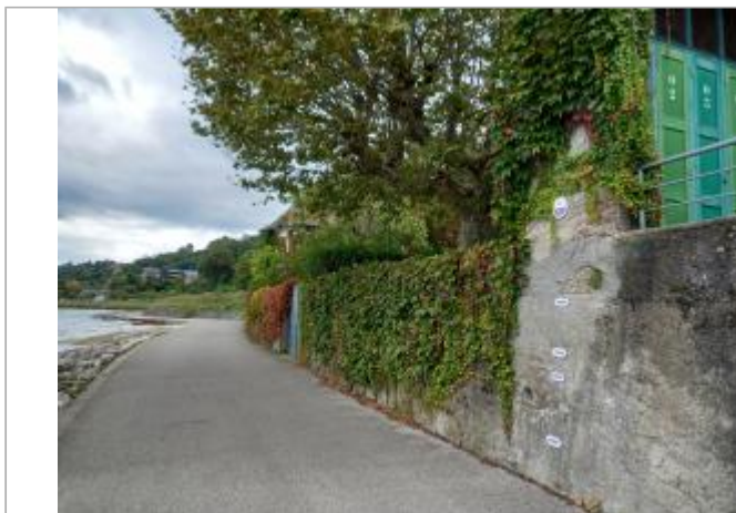
Mur d'enceinte de la maison des pêcheurs