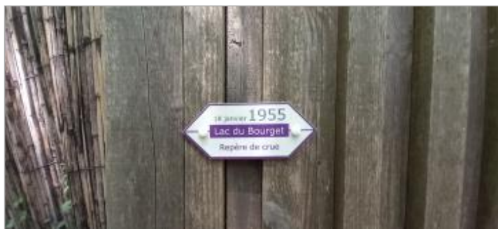
Repère de crue 18 janvier 1955