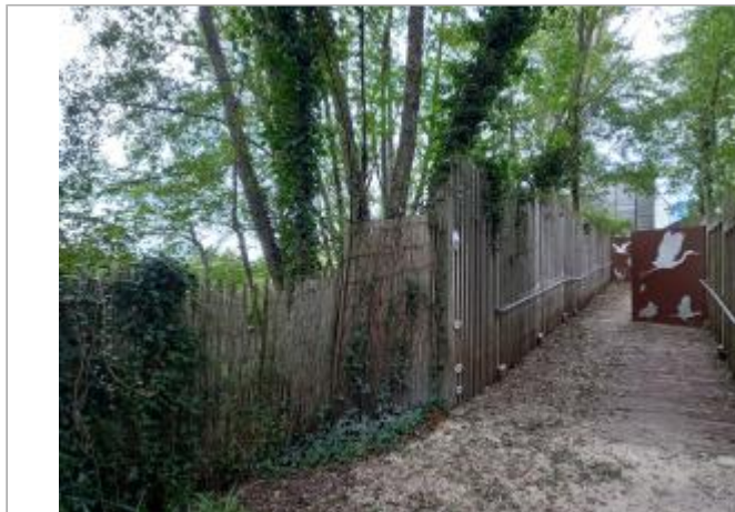
Entrée observatoire des Aigrettes

Coordonnées WGS84 : X: 5.86559932 / Y: 45.65085460