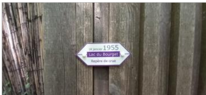
Repère de crue 18 janvier 1955

Texte : 18 janvier 1955 - Lac du Bourget - Repère de crue