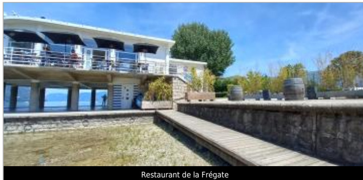
Restaurant de la Frégate

Coordonnées WGS84 : X: 5.86217105 / Y: 45.65599940