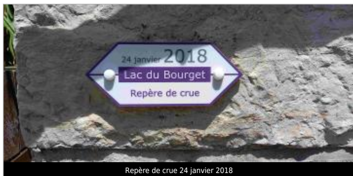
Repère de crue 24 janvier 2018

Texte : 24 janvier 2018 - Lac du Bourget - Repère de crue