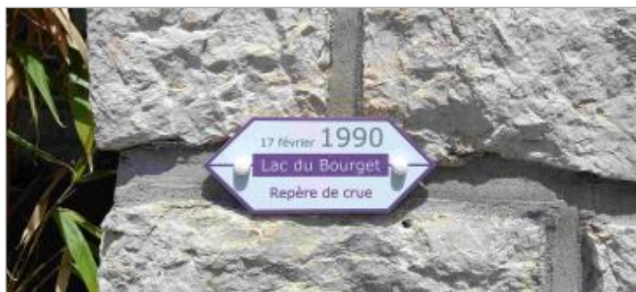
Repère de crue 17 février 1990