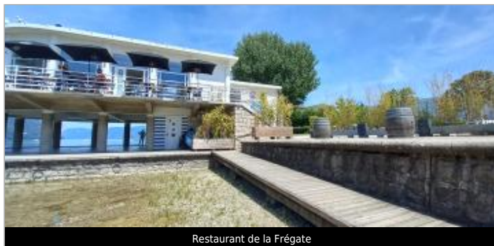
Restaurant de la Frégate