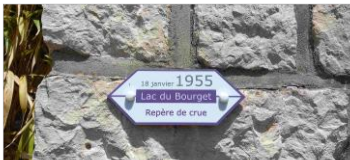
Repère de crue 18 janvier 1955