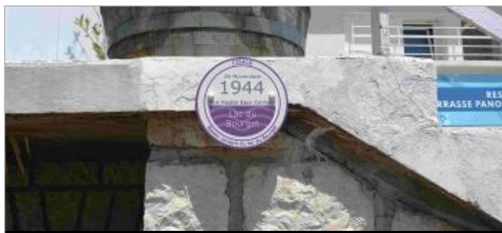
Repère de crue 26 novembre 1944