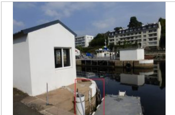
Morlaix écluse échelle amont