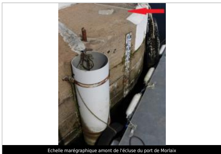
Echelle marégraphique amont de l'écluse du port de Morlaix

Altitude calculée de l'eau (en m) : 5.823 m