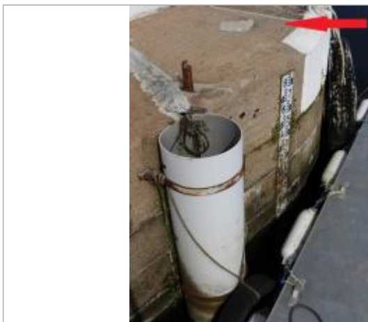
Echelle marégraphique amont de l'écluse du port de Morlaix

Altitude calculée de l'eau (en m) : 5.823 m