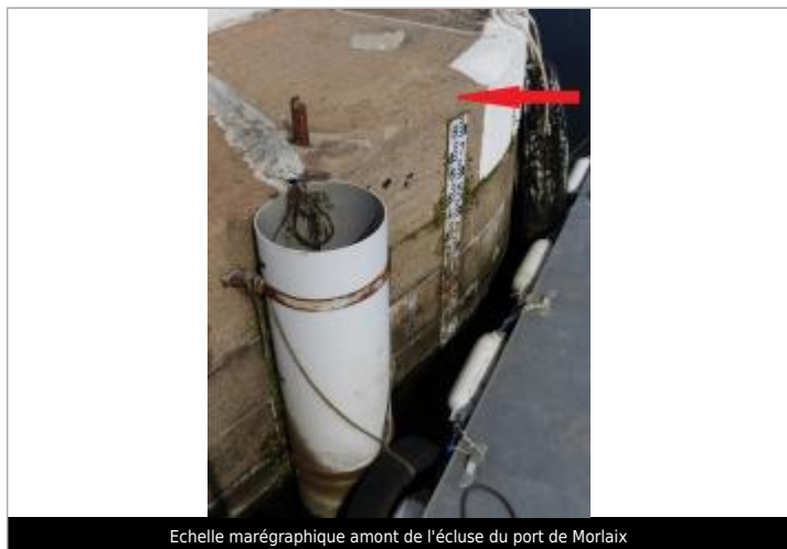
Echelle marégraphique amont de l'écluse du port de Morlaix

Altitude calculée de l'eau (en m) : 5.553 m