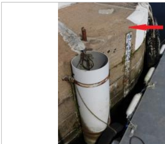
Echelle marégraphique amont de l'écluse du port de Morlaix

Altitude calculée de l'eau (en m) : 5.553 m