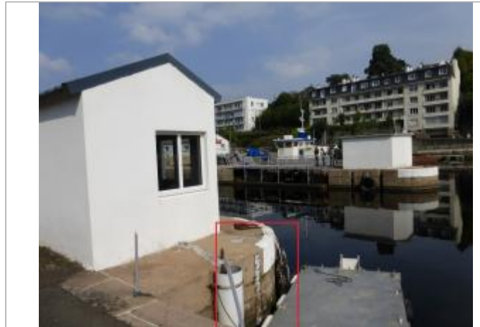
Morlaix écluse échelle amont

Coordonnées WGS84 : X: -3.83804090 / Y: 48.58776600