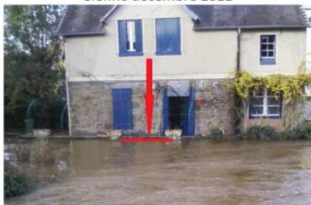
Laisse de crue située 20 cm en dessous du haut du muret.

SOURCE DE REPÉRAGE : CAMPAGNE LAISSES DE CRUES SAL VILLEDIEU LES POËLES (50639) - 18/05/2016