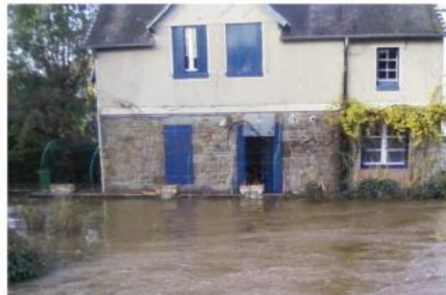
Muret en pierres devant maison au 16 rue Jean Castè.