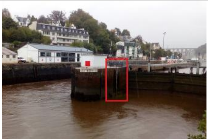
Morlaix écluse échelle aval