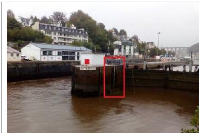
Morlaix écluse échelle aval