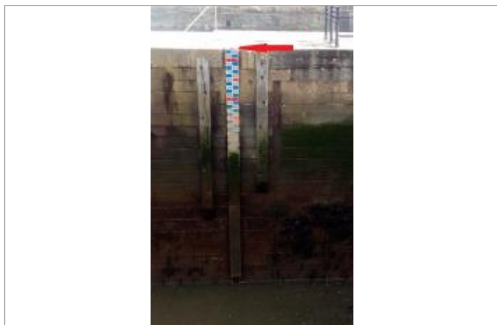
Echelle marégraphe aval de l'écluse du port de Morlaix

Altitude calculée de l'eau (en m) : 5.546 m